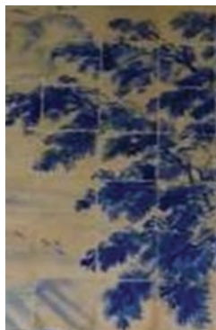
détail azulejos (Couvent de Arraiolos)