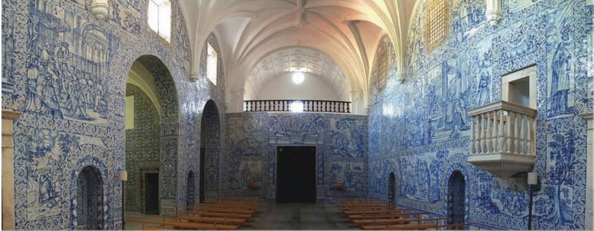
Couvent de Arraiolos, azulejos datés de 1700 de l'atelier de Gabriel del Barc

Ce disque sera l'un des tout premiers enregistrés en France autour du Soundpainting, au sein d'une nouvelle collection du label Musivi, et présentera le Soundpainting dans une version d'excellence.